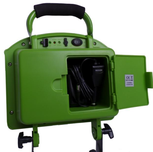
Compartment voor 220 volt en 12 volt auto-oplader.