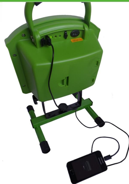
Opladen smartphone / camera etc. met de USB-oplader